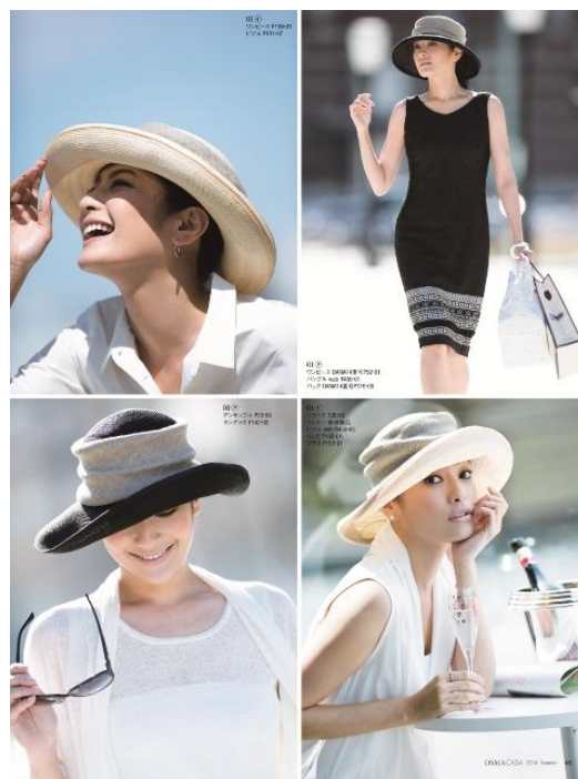
●H.at コラボ オリジナルクロッシュ 49,800円 色:ブラック、ベージュ *価格は税別