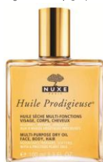
販売中の通常モデル

ブランドのアイコン的アイテムの美容オイルは、6種類の植物オイル（保湿成分）とビタミンE（製品の抗酸化剤）を配合した美肌効果の高さと独特な芳香で、男女を問わず世界中で人気を集めています。顔はもちろん、ボディや髪に使えるサラッとした使用感でのびがよく、すぐに肌になじみます。香水のような残り香も魅力です。フランス製。※2011年11月末時点年間。フランス+インターナショナル出荷ベース。2013年現在64か国で展開。