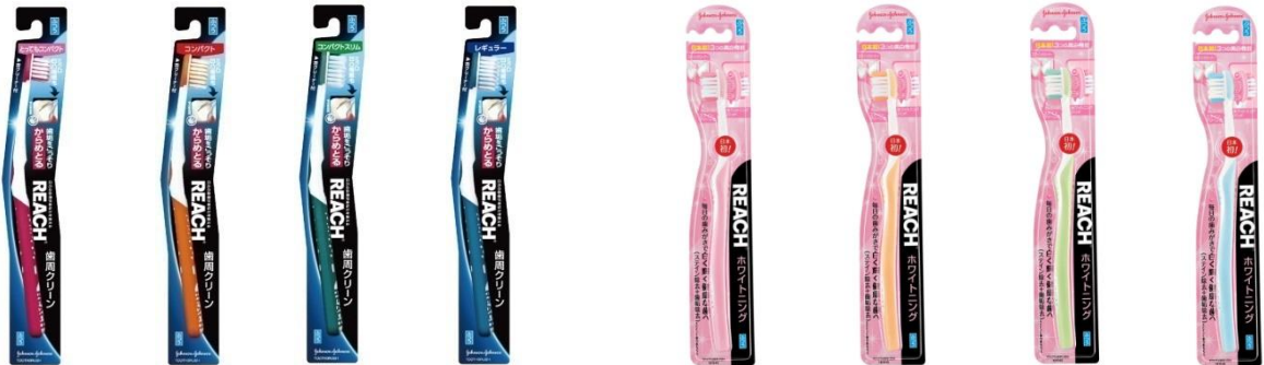
「リーチ® 歯周クリーン」