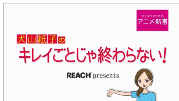
「REACH プレゼンツ 犬山紙子のキレイごとじゃ終わらない！」 第1回「女の自信は顔に出る？」篇より