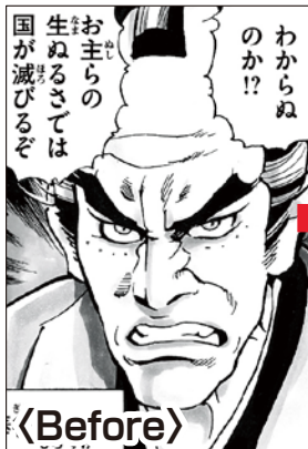
[寿司で人生が変わった登場人物たちの Before/After]

現在ドラマが放送中の「孤独のグルメ」の原作者・久住昌之氏も、本作を読んで「今すぐ江戸に行って握り寿司食いてえ!」とコメントしています(単行本帯コメントより)。