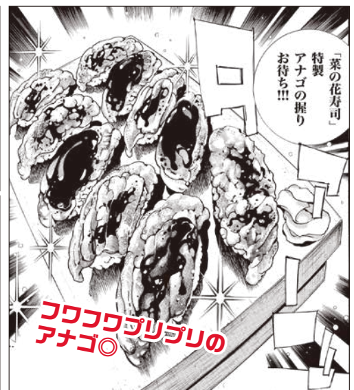
【作中に登場する、魅力たっぷりのお寿司たち】