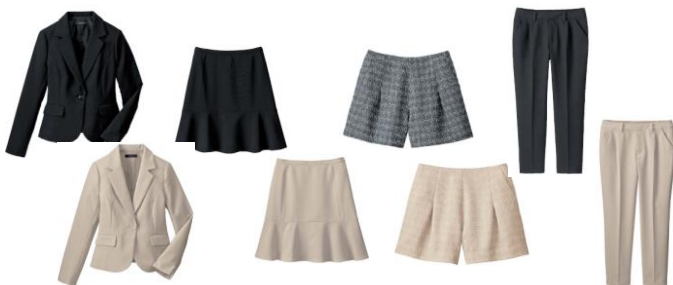
IMAGE4 点ウォッシュアップルスーツ (税抜価格：10,000円)

自宅で洗えて実用性も抜群のウォッシュアップルスーツが、最新のトレンドを取り入れて、税抜10,000円で新登場。丸みのある裾と短め丈がポイントのジャケットに、タック入りパンツ、裾ペプラム切り替えのフェミニンスカート。そして、スーツとは異素材のツイード風キュロットの4点セットです。