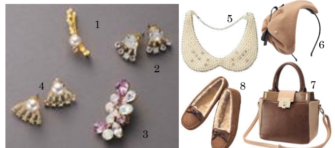
1 パールデザインイヤークリップ (税抜価格：2,390円) 2 デザインピアス (税抜価格：1,990円) 3 カラービジュイヤークリップ (税抜価格：2,390円) 4 スターデザインピアス (税抜価格：1,990円) 5 パール調襟ネックレス (税抜価格：2,990円) 6 ベレー帽デザインカチューシャ (税抜価格：2,990円) 7 異素材使い2WAYバッグ (税抜価格：5,990円) 8 ファー付きモカシンシューズ (税抜価格：2,000円)

流行のイヤークセサリーから、襟ネックレスや、モカシンシューズ、異素材使いバッグなど、この秋おすすめのイマージュファッション雑貨を多数ラインナップ。