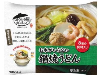
お水がいらない 鍋焼うどん