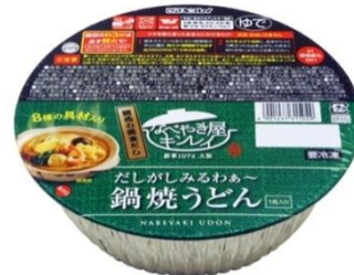
だしがしみるわあ～ 鍋焼うどん