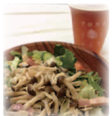
▲ 特別コラボメニュー 「マルシェ野菜のガーデンサラダ」 800円(税込)

赤坂「よなよな BEER KITCHEN」がプロデュースした、ヤッホーブルーイング社の人気商品が楽しめる唯一のビアガーデン。“よなよなエール”や“水曜日のネコ”などの定番はもちろん、新商品『ガーデンセゾン』も特別にご用意します。