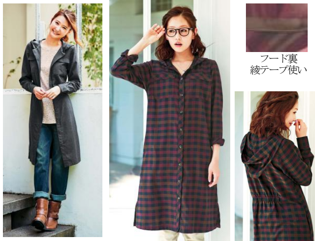
フード裏 綾テープ使い