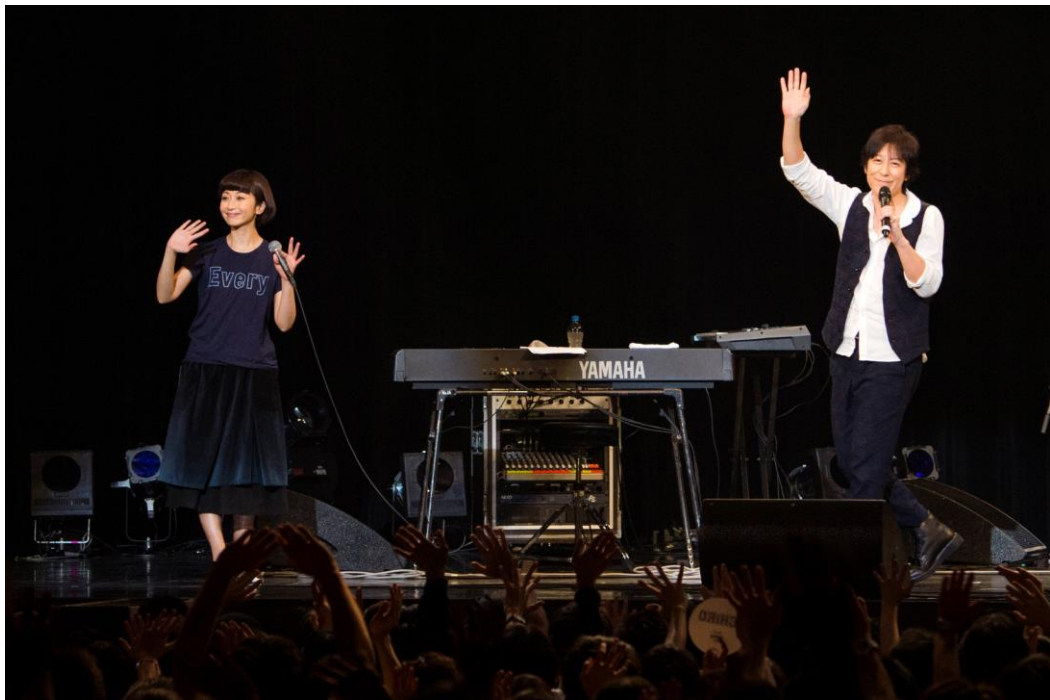
Every Little Thing

Every Little ThingオフィシャルWEBサイト http://avex.jp/elt/index.html J A Lホノルルマラソン オフィシャル WEB サイト www.honolulumarathon.jp