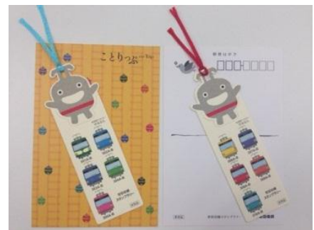
「ノベルティイメージ」