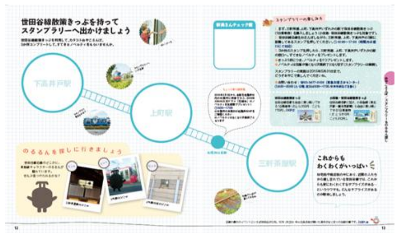
「スタンプラリーイメージ」