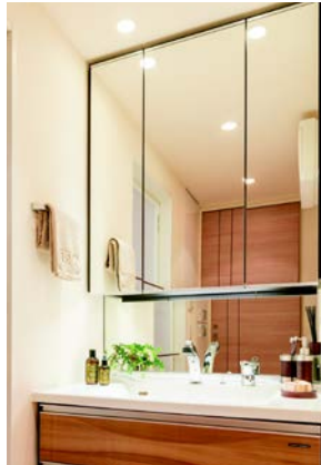
<洗面化粧台イメージ>