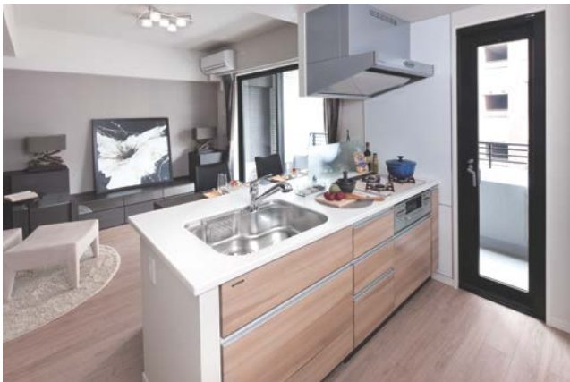
<キッチンイメージ>