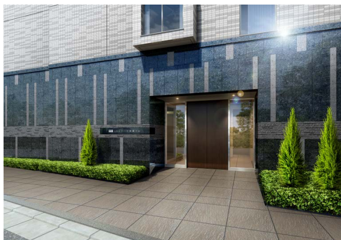
<アプローチイメージ>