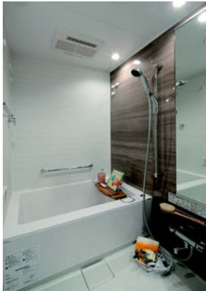
<バスルームイメージ>

室内の床にはキズにも強い特殊コーティングを施したフローリングを採用。高級感あふれる約145mmの幅広いタイプです。