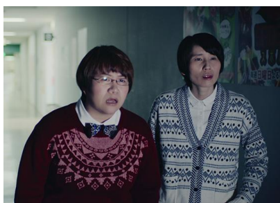
芸人として未来が気になる2人 ハリセンボン編