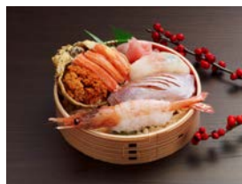
漁師の贅沢まかない丼