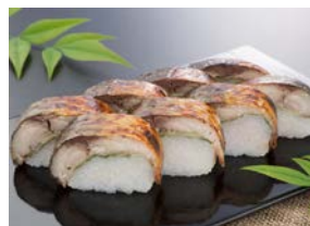
謹製 国産焼き鯖ずし