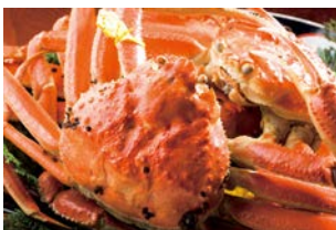
冬の味覚の王様「越前がに」