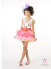
エントリープリント (モデル部門)

各会場：約100人 (モデル+ダンス部門) 特典： ランウェニスタ★コレクション ランウェイ出演