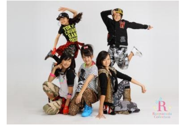
エントリープリント (ダンス部門)

各会場：約40組 (モデル+ダンス部門) 特典： ランウェニスタ★コレクション ランウェイ出演