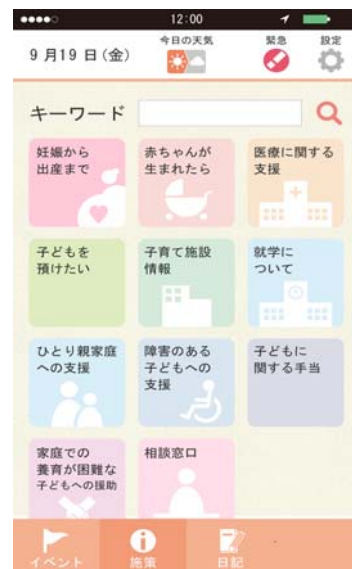
子育て支援施策検索画面