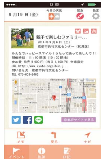
イベント詳細画面