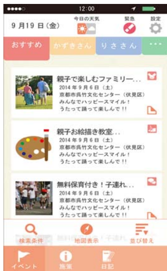
イベント一覧画面

参加したいイベント等を、メモ機能を使い登録をしておけば、イベント開催日に再度通知が届きます。