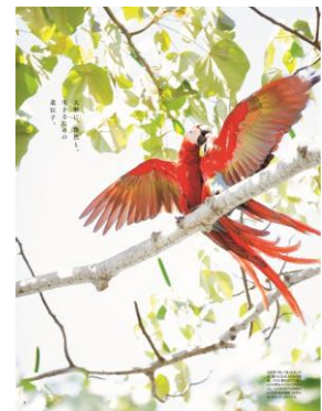
【P5で紹介】コスタリカに住む、野生の「コゴウインコ」。自然界で美しく強く、大きいのは、魅力と生命力がある証拠。

さらに、「ほんもの」を知るダーマ世代にふさわしいアイテムを提案する特集「本物を装う」をはじめ、今夏の新たな着こなしを提案したターゲットを効かせた「Nature Tone」、トレンドカラー「The White」、夏だからこそその素材や彩りに着目した「Mode CONSERVATIVE」など、見る人を魅了し、自分に合った服を選びやすいように、テーマごとに展開しています。