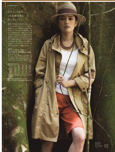
バイオ加工モッズ風コート 37,000円 ※価格は全て税抜き(以下同)