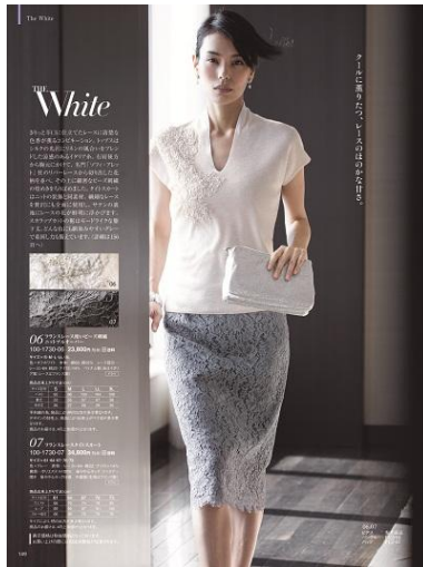
(左)フランスレース使いビーズ刺繍ニットプルオーバー 23,800円 (左)フランスレースタイトスカート 34,800円 (右)フランスコードレースAラインワンピース 49,800円