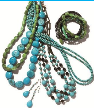
(左)ユキコ・オオクラ マグネサイトタンブルネックレス 7,000 円、(左から2番目)ユキコ・オオクラ マグネサイトデザインネックレス 8,000 円 ほか

■特集：Nature Tone ～ターコイズを効かせたネイチャーカラーの着こなしが新鮮な印象に。