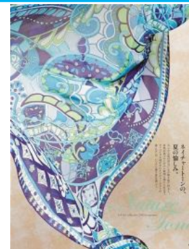
(中央)洗えるシルクジャージープリントチュニック 19,800 円