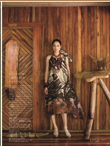
「エリカ」シルクパネルプリント ワンピース 39,800円