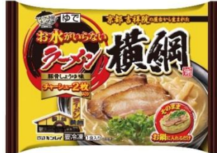
お水がいないラーメン横綱