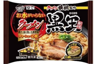
お水がいないラーメン黒王