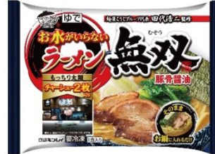
お水がいないラーメン無双