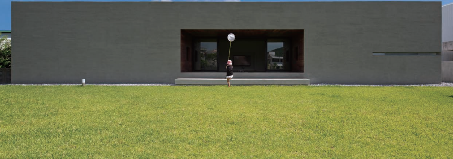
「南城の家」 設計:松山将勝 施工:ASJ沖縄南スタジオ