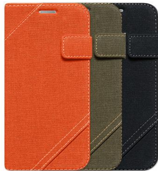
CAMBRIDGE DIARY for Galaxy S6