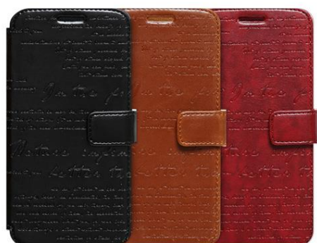
LETTERING DIARY for Galaxy S6