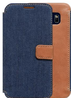
DENIM VINTAGE POCKET DIARY for Galaxy S6