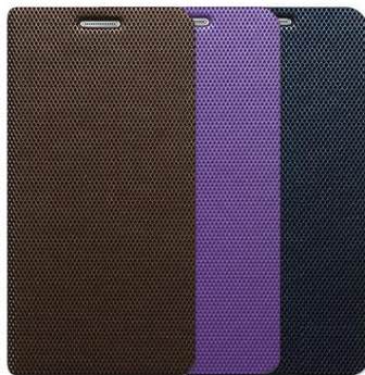
METALLIC DIARY for Galaxy S6

以下のシリーズは、Galaxy S6 / Galaxy S6 Edge のスリムなボディを損なわないデザインを採用したシリーズです。端末をホールドするはめ枠部分は耐久性と弾性に優れたポリカーボネート素材で作られています。脱着が簡単で安定感があり、イヤホンや充電ケーブル用の穴が開いているのでケースを外さなくても簡単に取り付けられます。