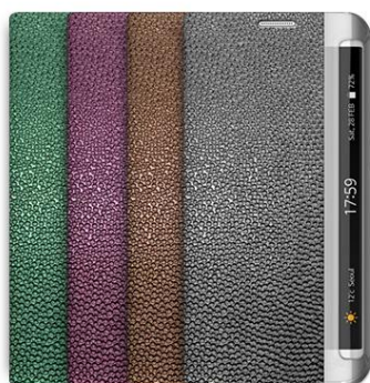
PLATINUM DIARY for Galaxy S6 edge