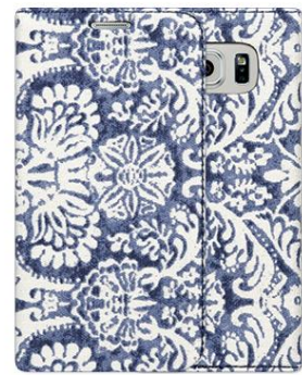
DENIM PAISLEY DIARY for Galaxy S6