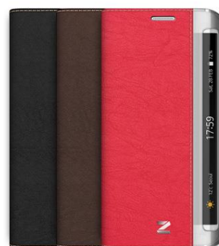
BUFFALO DIARY for Galaxy S6 edge