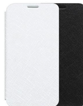
MINIMAL DIARY for Galaxy S6