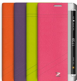
GEO DIARY for Galaxy S6 edge