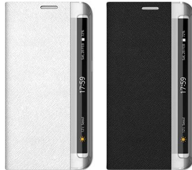
MINIMAL DIARY for Galaxy S6 edge