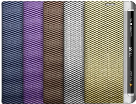
METALLIC DIARY for Galaxy S6 edge