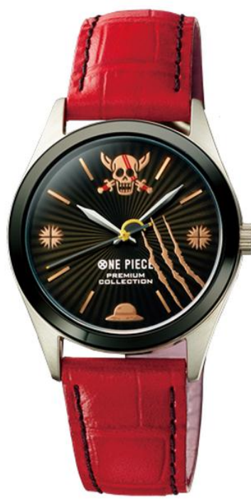
赤髪にちなんだ 華麗なレッドの革バンド