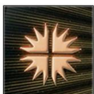
シャンクスのズボンの柄