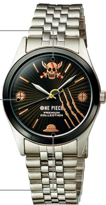
スタイリッシュな 銀色のメタルバンド