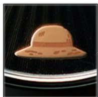
ルフィへと託した 麦わら帽子