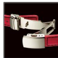
便利なワンブッシュタ イブの3つ折れバックル。