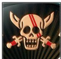
赤髪海賊団の海賊旗

海賊旗や、黒ひげにつけられた3本の傷など、シャンクスにまつわるモチーフを立体的にデザイン。秒針はシャンクスの剣をかたどり、背景には「霸王色の覇気」をイメージしたギョーシェ模様が浮かび上がります。