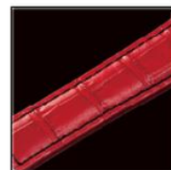
高級感あふれるクロ コ調型押しを施した、 上質の牛革製。