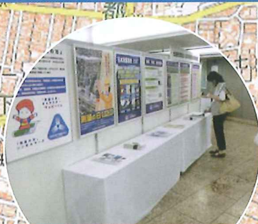
測量成品の品質確保 日本測量協会関東支部