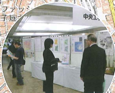
伝統ある実務教育 中央工学校