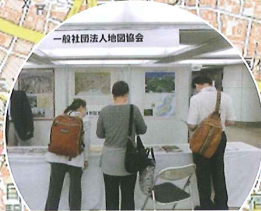
眺めて楽しい地図 地図協会