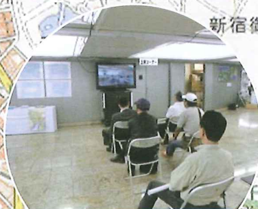
上映コーナー 国土地理院関東地方測量部

主催 「測量の日」東京地区実行委員会 共催 東京都 後援 新宿区 問い合わせ先 03(5213)2051