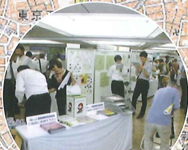
役に立つ地図、楽しい地図 地図調製技術協会