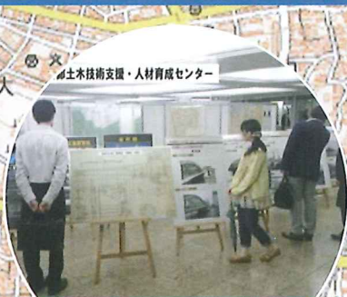
東京のまちづくりを支える 測量・土木技術をご紹介 東京都土木技術支援・人材育成センター