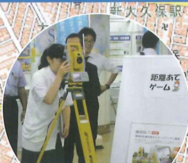
距離当てゲーム(景品付)もあるよ 東京都測量設計業協会