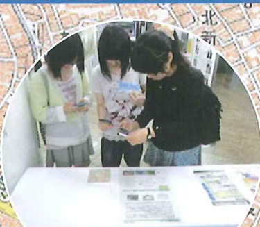
地図と測量の新時代 国土地理院関東地方測量部