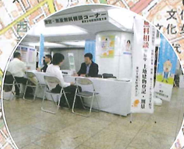
登記・測量無料相談コーナー 東京土地家屋調査士会