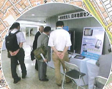
地図と空中写真のことなら 日本地図センター