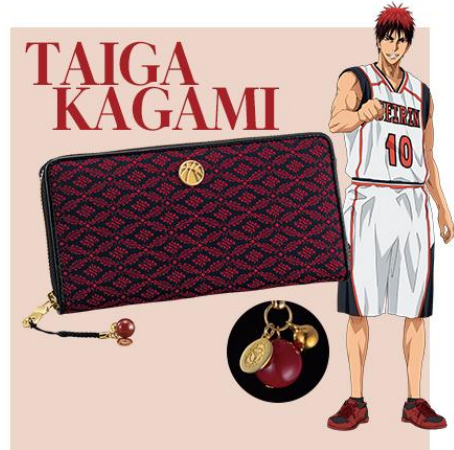
【火神大我：小葵文・濃緋色】

火神の内なる情熱をあらわすように、濃緋色の小葵文が一面に浮かび上がる。黒い背景とのコントラストも鮮やか。