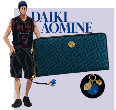
【青峰大輝：紗綾形・紺青】

武家にも好まれた紗綾形を連ねて、貪欲にゴールへのルートを描く。生粋の点取り屋（スコアラー）にふさわしい、潔く力強い印象。