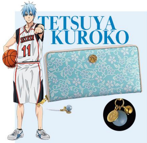
【黒子テツヤ：鶯に子桜文・空色】

黒子にびったりの淡い空色に、鶯と子桜文を配して。控えめなのに、気がつけばいつもそばにいる、まさに「幻の6人目（シックスマン）」さながら。