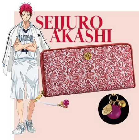
【赤司征十郎：桐竹鳳凰文・緋色】

古来、高貴な者のみで使用することを許された桐竹鳳凰文を織り上げて。「天帝の眼（エンペラーアイ）」をもつ赤司にふさわしい典雅な意匠。