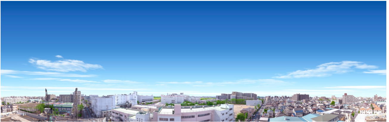
【現地南側眺望イメージ】

※「第一種住居地域」とは都市計画法で「住居の環境を保護するため」に定められる用途地域。3,000平方メートル以上の店舗・事務所や、住環境を害する工場・遊技場・娯楽施設などは建設することはできません。