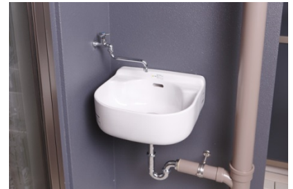
【 スロップシンク 】