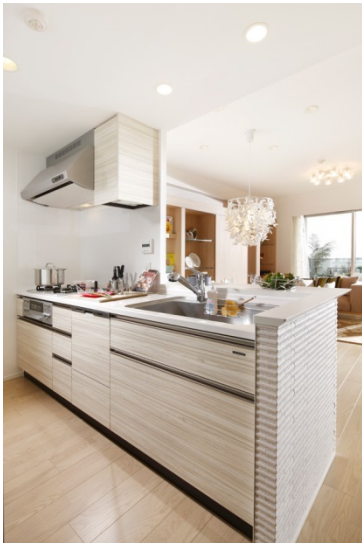
【 対面カウンターキッチン 】

その他、子どもの成長に合わせて容易に間取り変更できる工夫などを取り入れています。