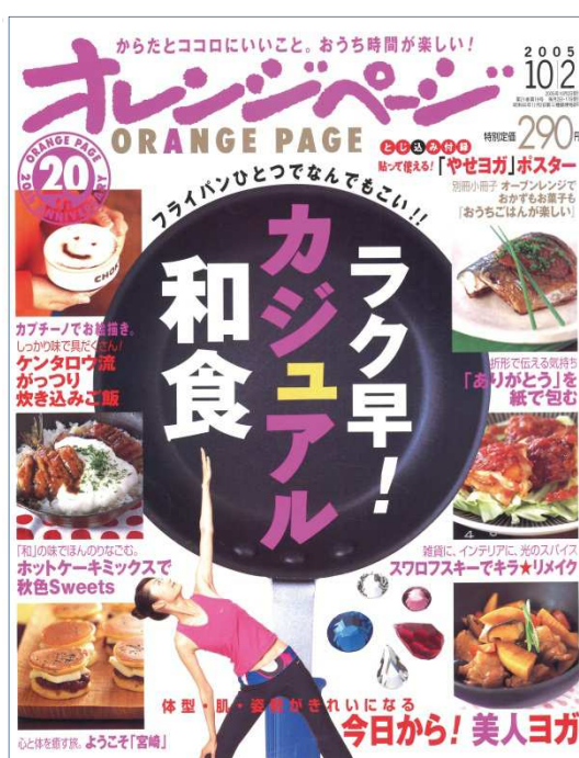
2005年10/2号 表紙 特集「フライパンひとつでなんでもこい!! ラク早! カジュアル和食」

こうしてフライパンはキッチンの主力選手に！ そして、それまで、ハードルの高かった料理も、フライパンで手軽に、簡単に作られるようになります。