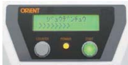
充電中のカウント表示

液晶画面によりチャージ時間のカウント表示やエラー状態、消去時の発生磁気など確認でき、使いやすさがいっそう向上しました。