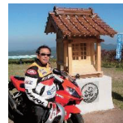
物語を考え、生み出す観光地