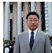
外から見た浜田市の魅力と課題