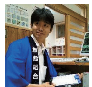
温泉の効能の再発見