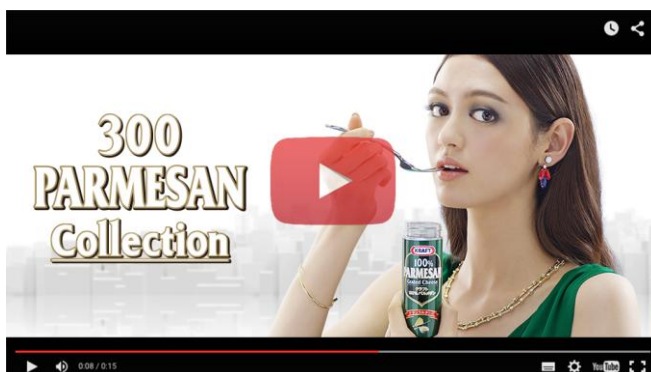
〈オリジナルムービー イメージ〉