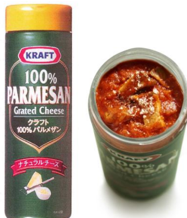
〈ランチボックス イメージ〉