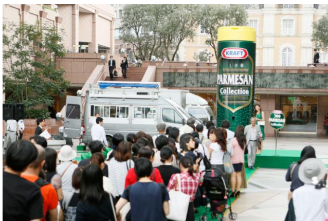
〈恵比寿ガーデンプレイスでのイベントの様子〉