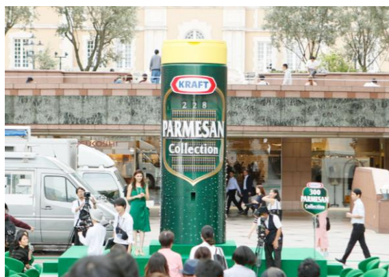
〈前回のイベントで設置されたベンディングマシンの様子〉

「クラフト 100%パルメザンチーズ」のパッケージデザインをそのまま大きくし、高さが同製品(80gサイズの高さ:14.3cm)と比較すると約 32 倍にあたる、4.6mの巨大なベンディングマシンが会場に登場。ベンディングマシンには、300 個のボタンがついており、好きなボタンを選んで押すと 10 種のランチボックスのうち、1 つがランダムに提供されます。また、ベンディングマシンにはランチボックスの残数が表示され、提供に合わせてカウントダウンいたします。