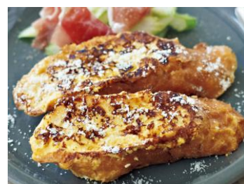
〈パルメチーズフレンチトースト〉