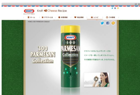
〈スペシャルサイト イメージ〉

【オリジナルムービーURL】 http://www.youtube.com/watch?v=eoghjCIFRT0