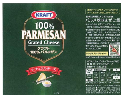
〈ラベルデザイン パルメ秋味ませごはん〉

提供されるメニューのレシピは、クラフトチーズレシピ WEB サイトで公開しています。