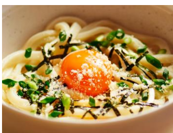
〈パルメ釜玉うどん〉