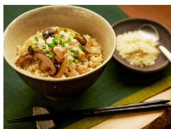
〈秋味パルメ混ぜごはん〉