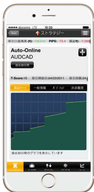
ストラテジーカード