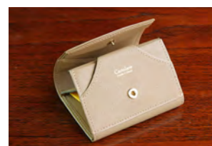
Grayish Brown × Yellow