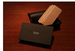
Dark Brown×Grayish Brown