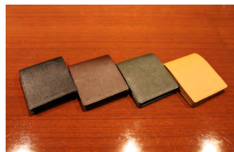
メモできる本革二つ折り財布 | 小銭入れ付き