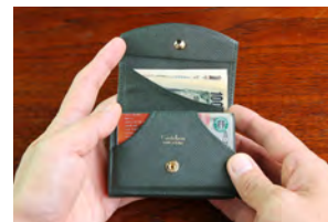
三つ折りのコンパクトサイズ

ハンモックウォレット コンパクトは、ハンモックウォレットの機能と使いやすさをそのままに、さらにコンパクトサイズに進化しました。