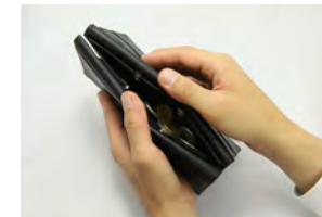
浅い小銭入れで取り出しやすい