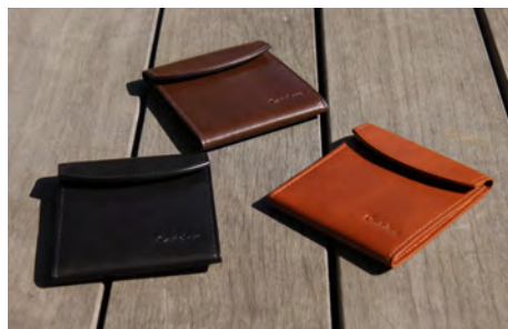
フラットウォレット