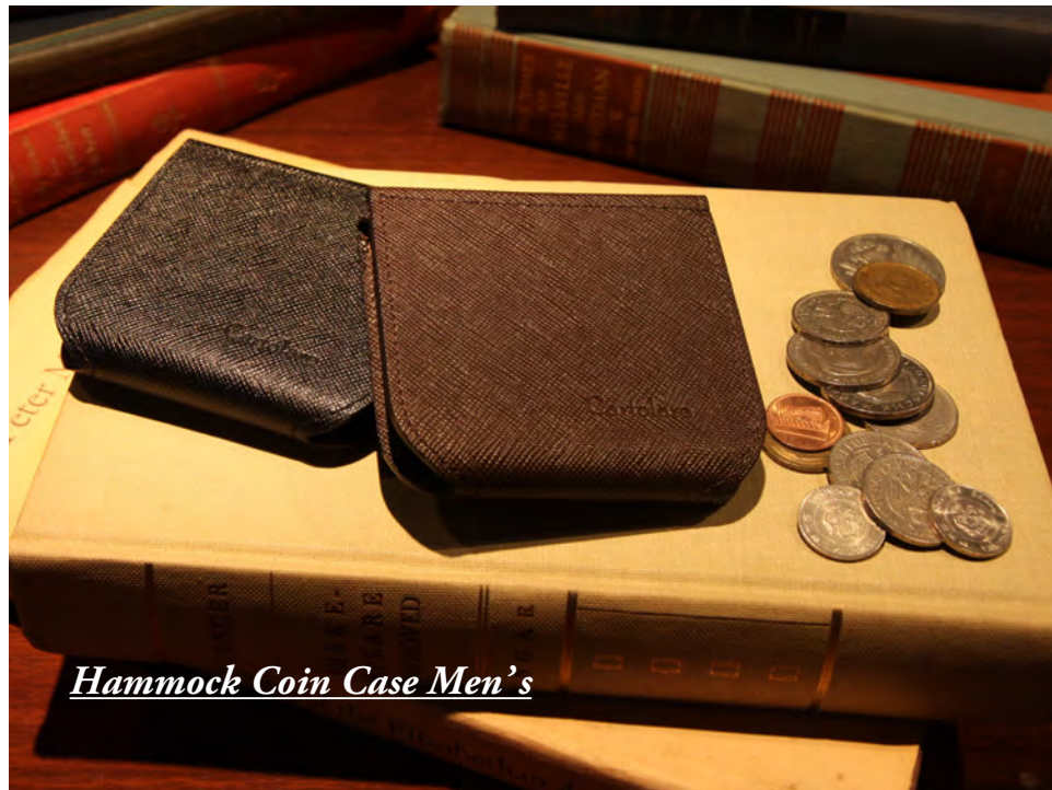
Hammock Coin Case Men's