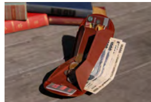
小銭の視認性抜群、お札やカードも取り出しやすい