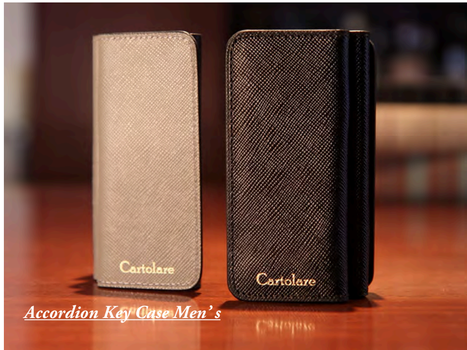
Accordion Key Case Men's