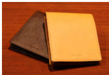
Dark Brown / Camel