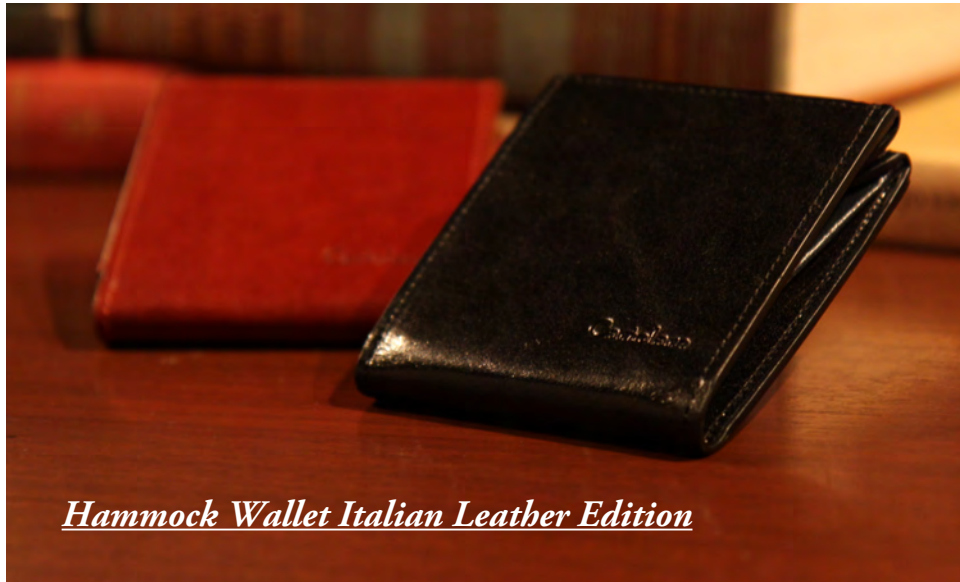
Hammock Wallet Italian Leather Edition