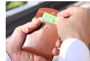
便利なカード収納