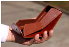
Dark Brown×Dark Brown