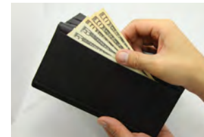
取り出しやすいお札入れ

男性が所持する財布は品格を大切にしたい。好みのメモ帳やふせん紙を財布内にセットできるのが特徴で、昼食時など財布だけを持ち出した場合でもアイデアを逃さずに書き起こす事ができる。また、製品の政策は東京下町の職人が手がける事で、大人のビジネスパーソンが使うのに相応しい仕上がりとしました。