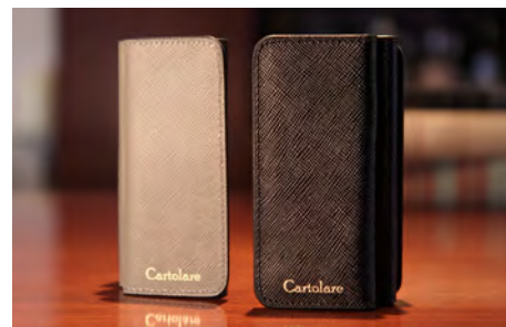
アコーディオンキーケース〈メンズ〉