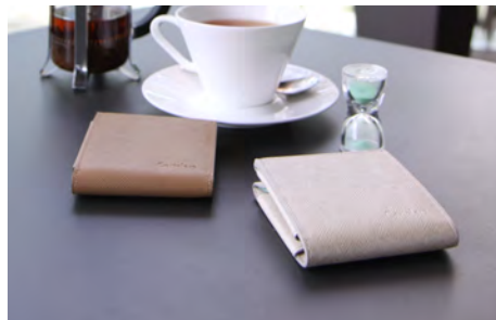
ハンモックウォレット〈レディース〉