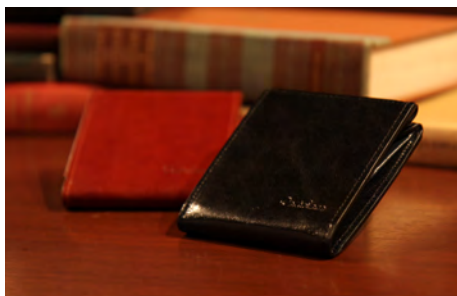
ハンモックウォレット〈イタリアンレザー〉