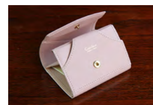
Light Pink × Pearl Cream