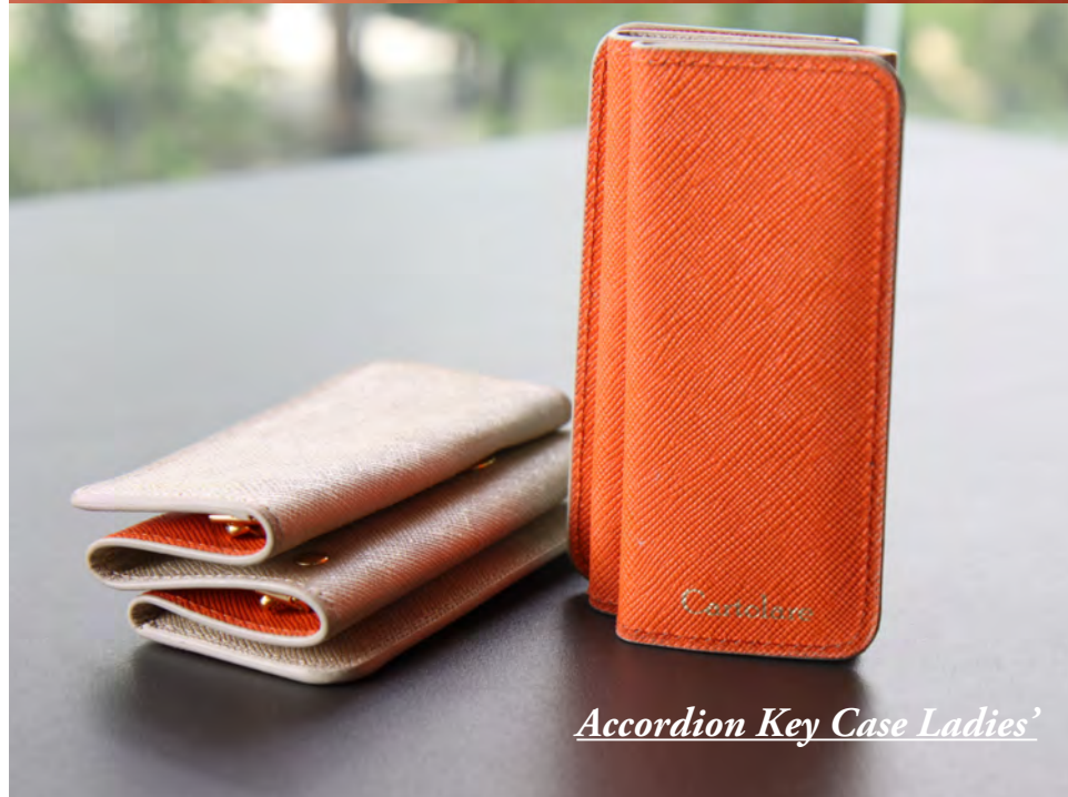
Accordion Key Case Ladies'