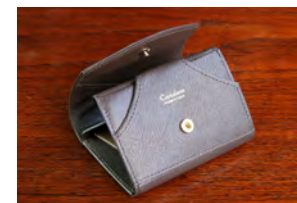
Dark Brown×Dark Brown