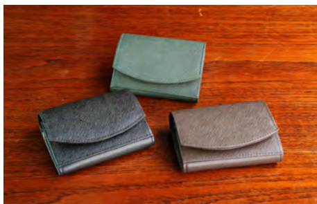
ハンモックウォレット コンパクト〈メンズ〉