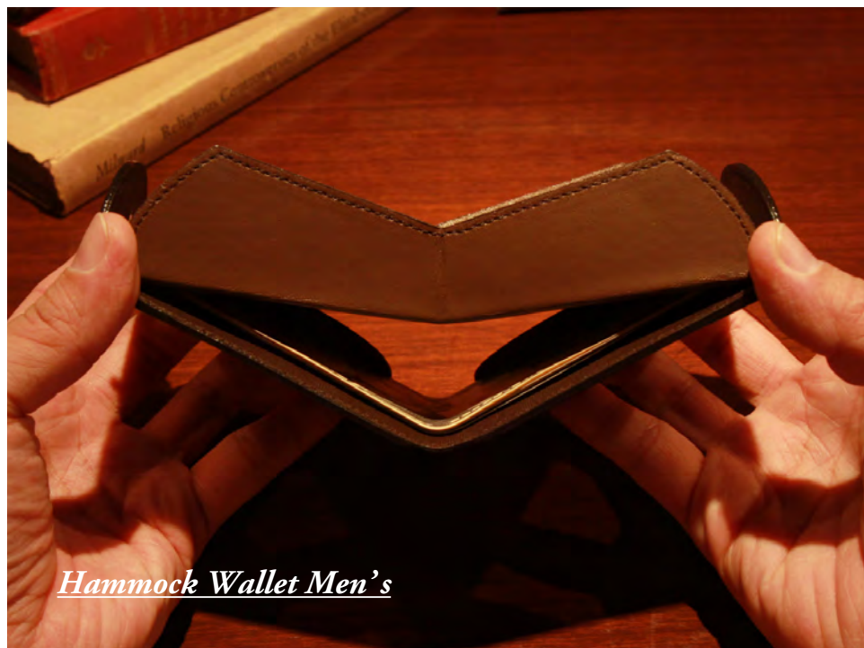
Hammock Wallet Men's