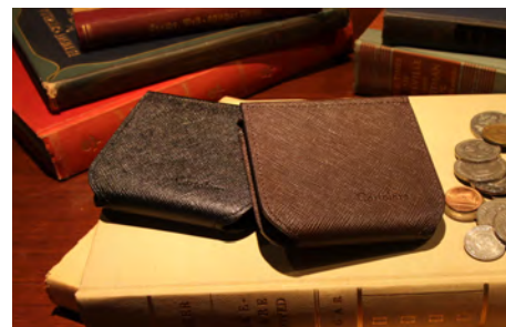
ハンモックコインケース〈メンズ〉