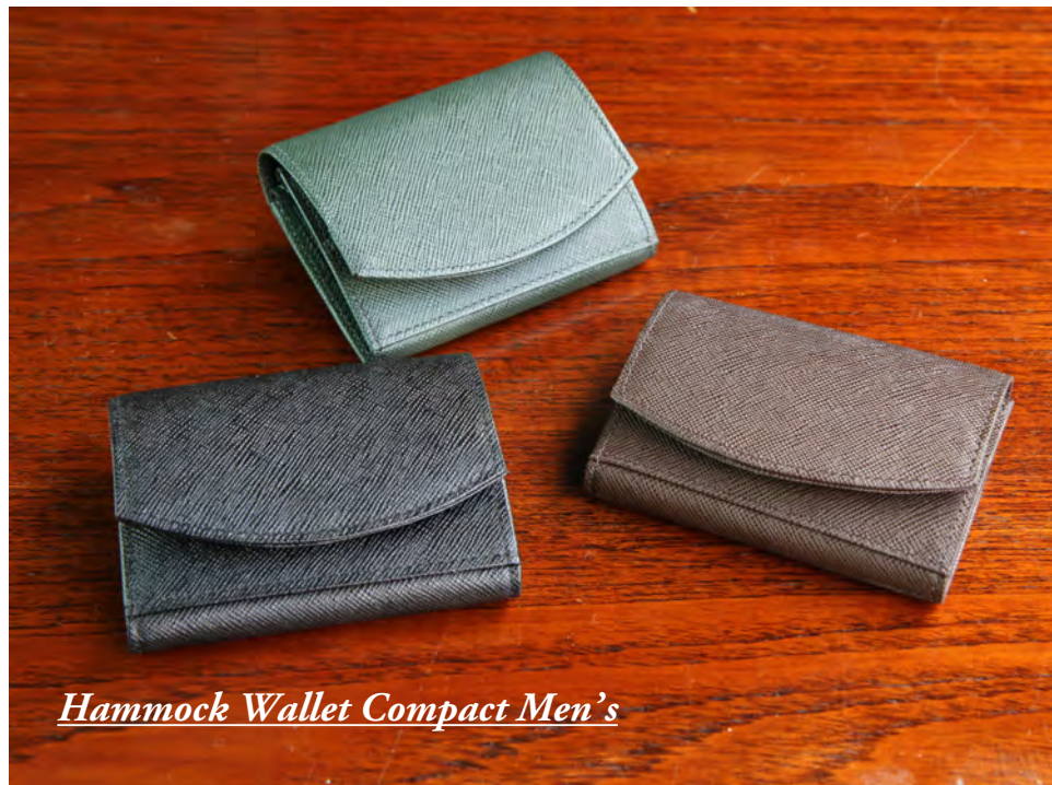
Hammock Wallet Compact Men's