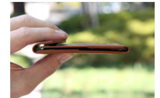
胸ポケットにも入る薄さ