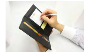
いつでもメモできて便利