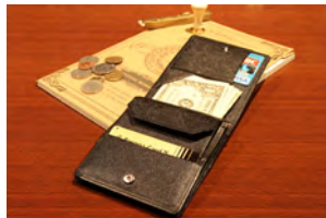
職人技により実現した薄さ

より快適なお札と小銭の取り出しやすさを目指しました。ビジネスシーンに最適なカラーバリエーション展開も魅力。メモできる本革長財布の機能そのままに二つ折り財布にリデザインしました。