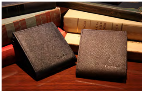
ハンモックウォレット〈メンズ〉