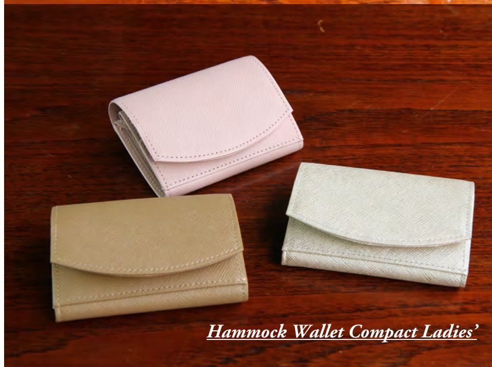
Hammock Wallet Compact Ladies'