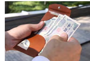
独自構造によりお札が取り出しやすい

休日のラフスタイルからビジネスシーンまで、ジーンズのポケットでも、スーツやワイシャツの胸ポケットでも、その薄さもたらす快適な使い心地が、あなたのライフスタイルの質を変えてくれます。小銭を持たないスマートライフのマストアイテム。