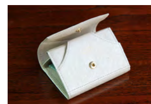
Pearl Beige × Bule Green