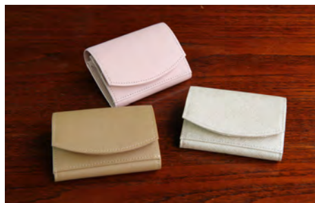
ハンモックウォレット コンパクト〈レディース〉