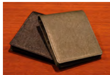
Black / Dark Green