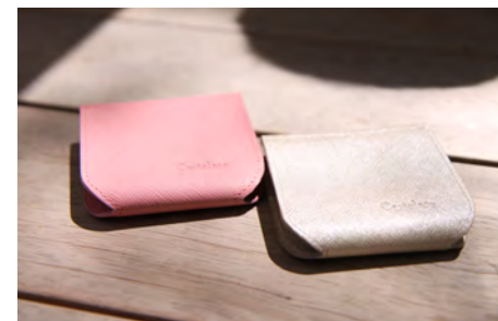
ハンモックコインケース〈レディース〉