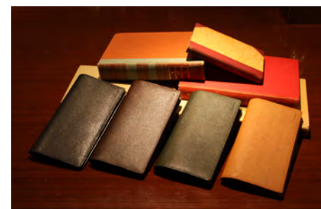
メモできる本革長財布 | 小銭入れ付き