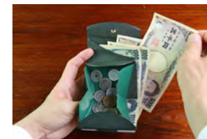
小銭の視認性抜群、お札やカードも取り出しやすい