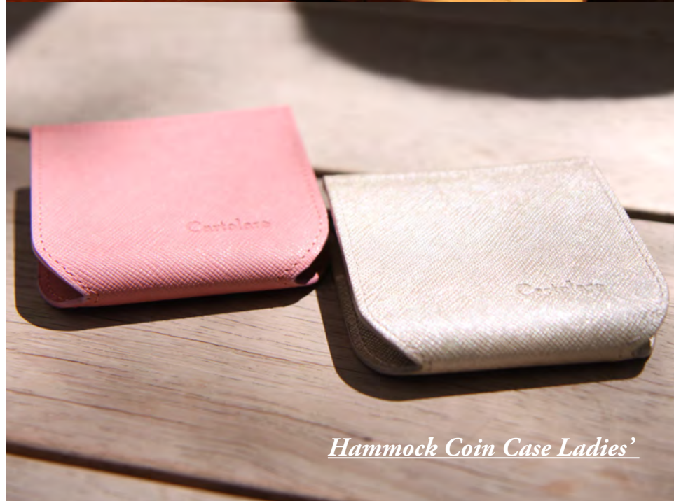
Hammock Coin Case Ladies'