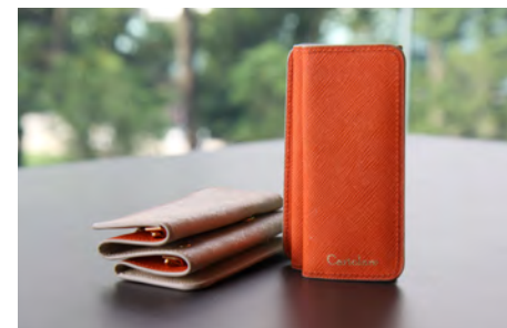
アコーディオンキーケース〈レディース〉