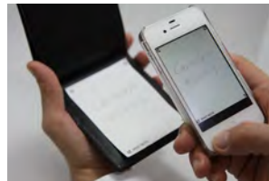
手書きのメモをデジタル化