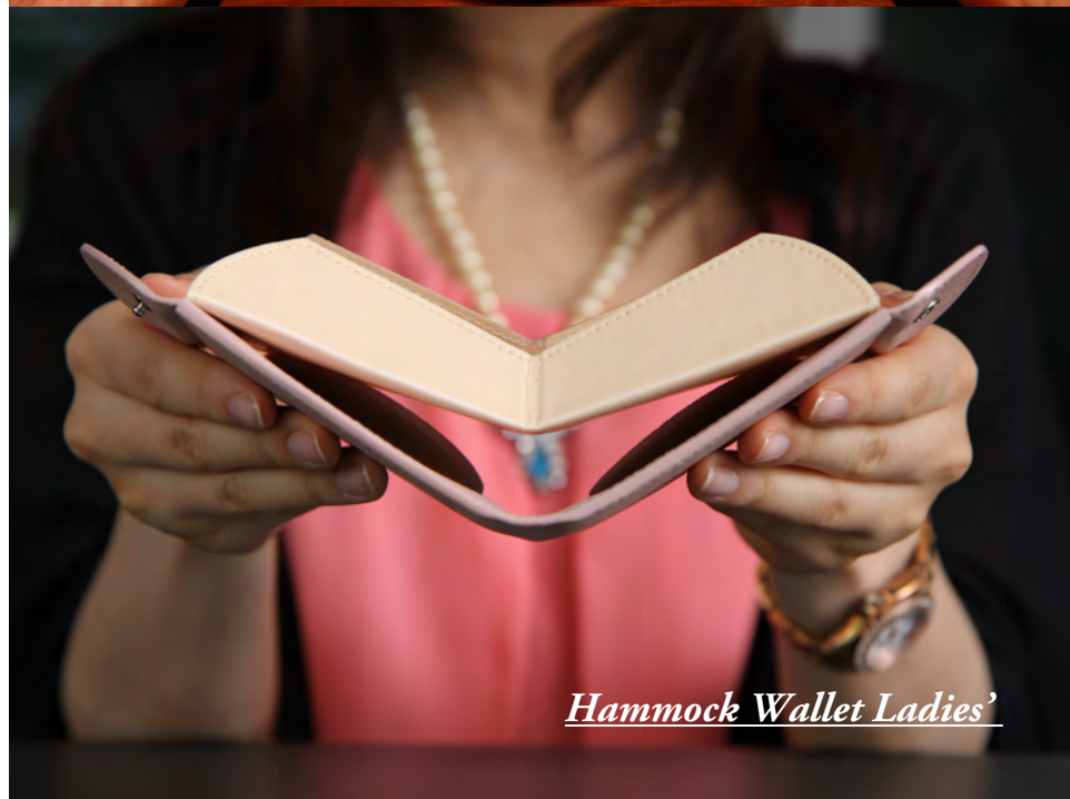
Hammock Wallet Ladies'