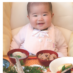
ファースト・フォーマルスタイ