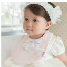
フォーマルポケットチーフセット