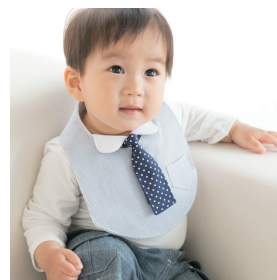
シャツスタイ+(プラス)