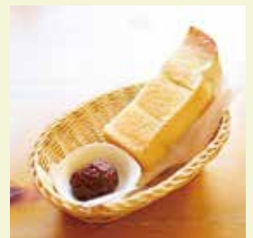
名古屋名物！小倉トースト