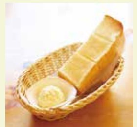
お店で手づくり！玉子ペースト