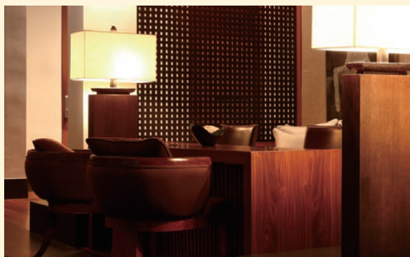
ホテルや百貨店などの カウンターサービスとして

例えば、このようなシーンでペーパーグラス(老眼鏡)のサービスを提供いただけます。