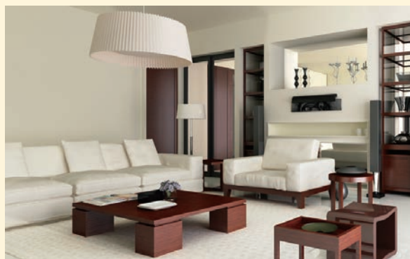
百貨店やお得意様サロンなどの カスタマーサービスとして