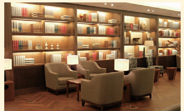
空港やVIPなどの ラウンジ内レンタルサービスとして